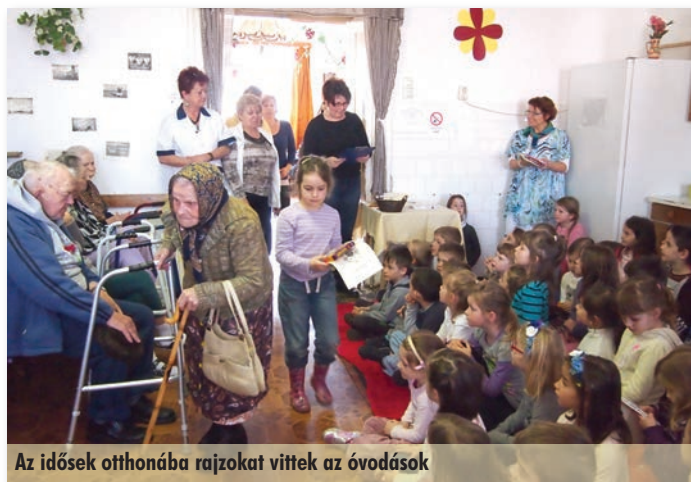
Az idősek otthonába rajzokat vittek az óvodások

Az első hetekben már minden csoportban sorra készültek a zászlók, kokárdák. Voltak, akik festettek, voltak, akik hajtogattak, ragasztottak. Természetesen szó esett Petőfiről, Kossuthról, az 1848-as csatáról. Ez az az ünnep, amiről jól lehet mesélni az ovisoknak. Szavaltuk a Nemzeti dalt, szólt egy-két Kossuth nóta. Aztán március 15-én zászlót tüztünk a Damjanich szobornál.