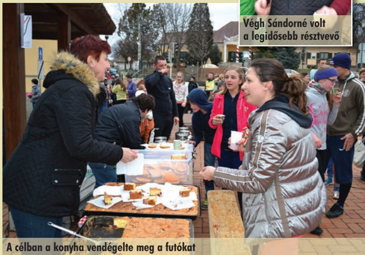
A célban a konyha vendégelte meg a futókat