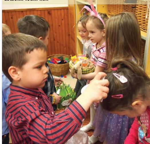
Locsolni tudni kell

A tavaszi szünet megkezdése előtt már nagyon vártuk a nyuszt! Nagyan folyt a tojásdíszítés minden csoportban. Többféle technika jelent meg, úgy, mint a berzselés, festés, ragasztás. Meg is lett az eredménye a készülődésnek, mert bizony a nyuszi erre járt, és hozott egy kis ajándékot a gyerekeknek.